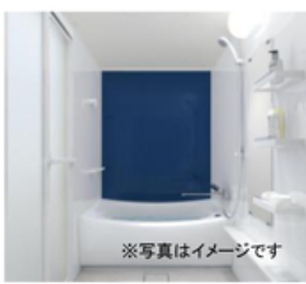
高断熱浴槽 (魔法びん浴槽)