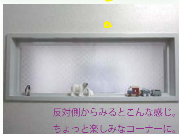
反対側からみるとこんな感じ。ちょっと楽しみなコーナーに。