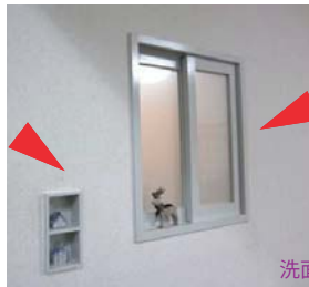
洗面所に取付けたかわいい小窓。反対側からみるといい雰囲気です。